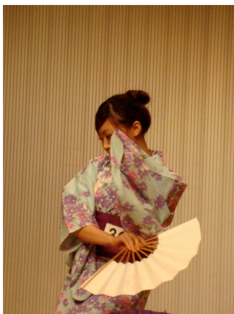
參加日本傳統舞蹈大賽