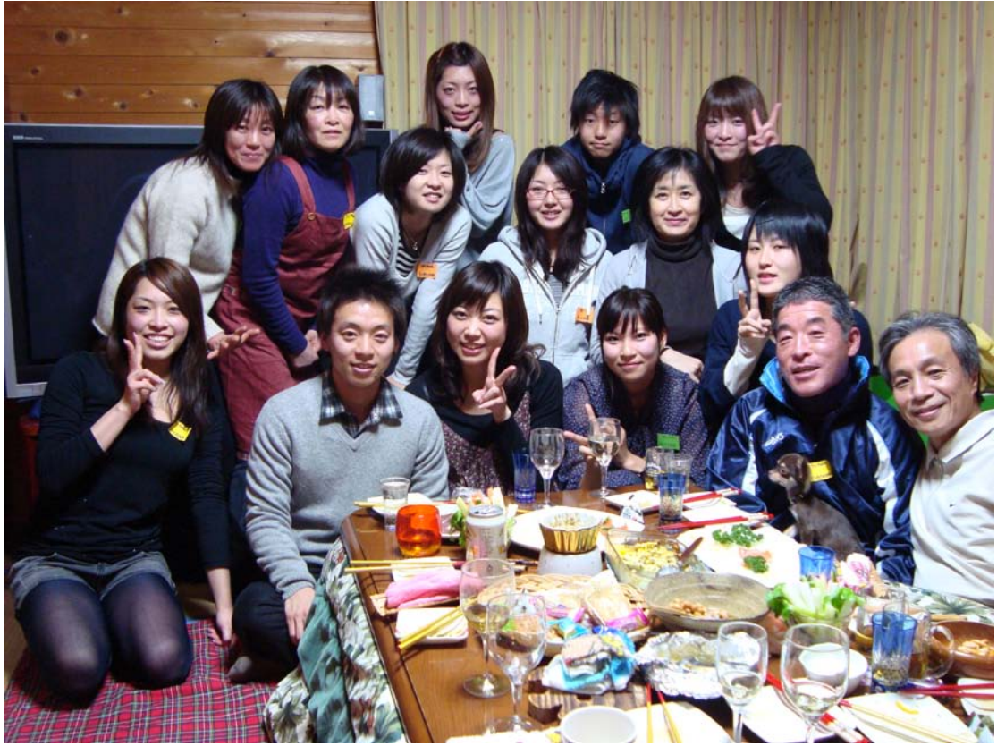
去日本友人家過日本新年