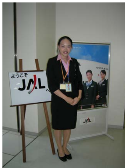
2008年7月1日訪問日本航空總公司