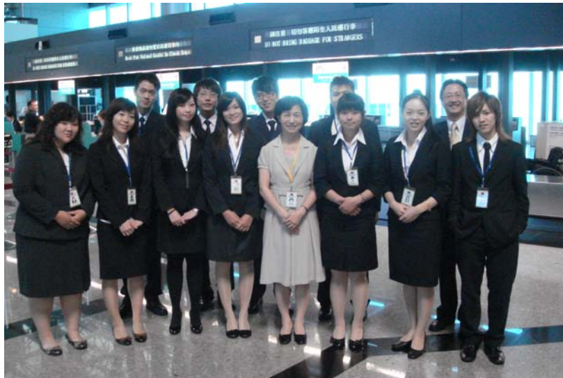
2008年第三十屆訪日團成員，我在前排右二

才)，因為是正式的訪日行程，除了參訪日本交流協會、台北駐日經濟文化代表處、國會議事堂、日本航空總公司之外，我們也跟東京大學、杏林大學的學生作交流，所以，當平日苦練的外星語居然可以達到跨國際溝通的那一刻時，相信所有學語文的人感觸最深並且會覺得所有努力與辛苦都是值得的。學了幾年的語文才發現所有基礎功夫都必須靠自己努力，老師只是從旁扮演協助引導的角色，更好的老師則能提高學生學習語文的動機，我推薦同學嘗試語言交換或是找跟日語有關的打工機會，在學以致用的過程中便能知曉自己不足的地方，再進一步修正，學習語言是無止盡的，在日文的大道上期盼與大家一起共勉之。