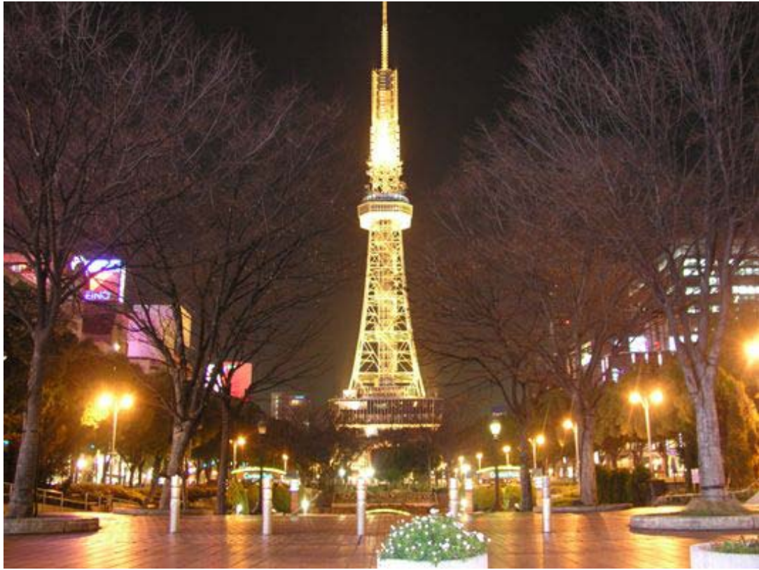
上圖：名古屋電視塔