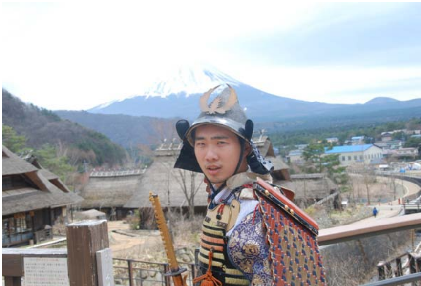
上圖：我穿武士裝在富士山前一拍

最後，不禁想要打個廣告，那就是像要以最省錢的方式學日文，就是修中山大學外文系所開的課程，比起校外私人補習班的高昂學費，在中山只要是本校生，就可以選日文課。雖然一周才三個小時，但我想當你修到了日三時，你的日文也有一定的水準了。