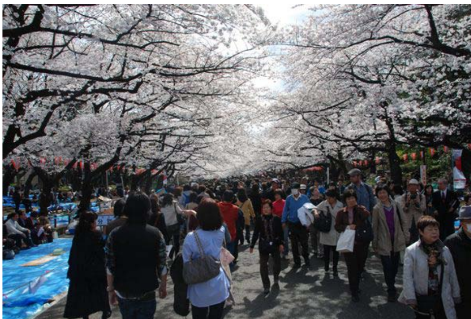
上圖：櫻花滿開的上野公園