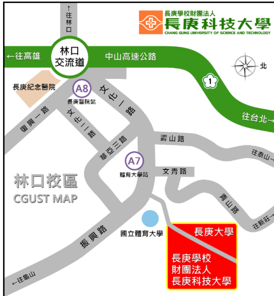
林口校區地理位置