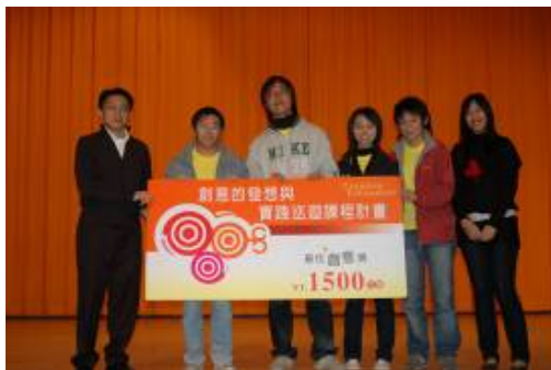
The one 小隊的「愛心e電園」

除了網頁上的電子檔成果外,另有八隊學生團隊的創意專案計劃書。其中兌簿隊的「娃娃的春天」、The one小隊的「愛心e電園」分獲教育部創意發想與實踐南區觀摩賽第二、三名 1 。並將代表參加96年1月22日於台北舉行的全國決賽。