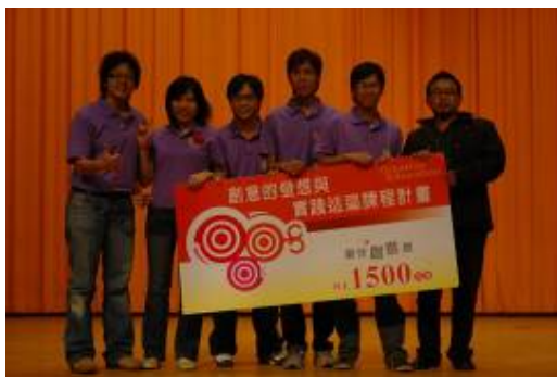
兌簿隊的「娃娃的春天」